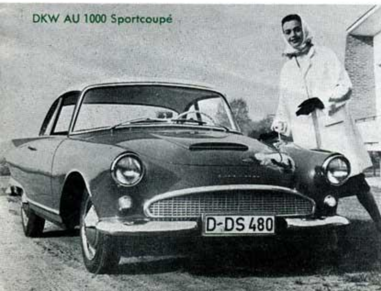
DKW AU 1000 Sportcoupé