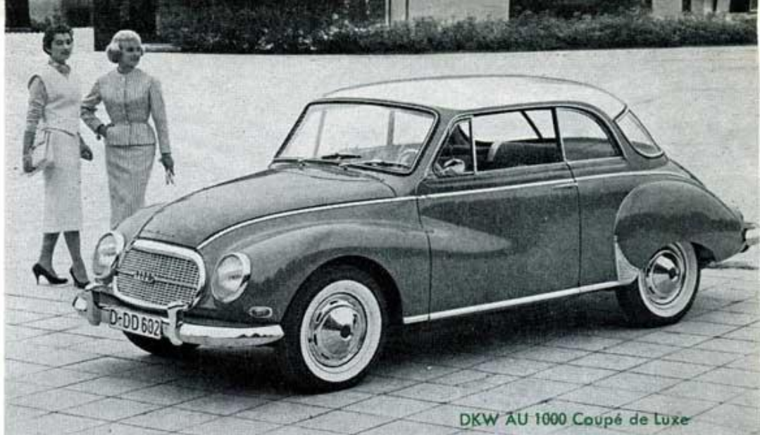
DKW AU 1000 Coupé de Luxe

Det är ingen tillfällighet att allt flera väljer DKW. Den slitstarka 3-cylindriga tvåtaktaren vinner vänner över hela världen bland kvalitetsmedvetna bilköpare. Givetvis bidrar även bilens särpräglade elegans till att så är fallet. Den ökade efterfrågan har bl. a. medfört en utvidgning av DKW:s leveransprogram som i dag omspannar allt från exklusiva sportvagnar