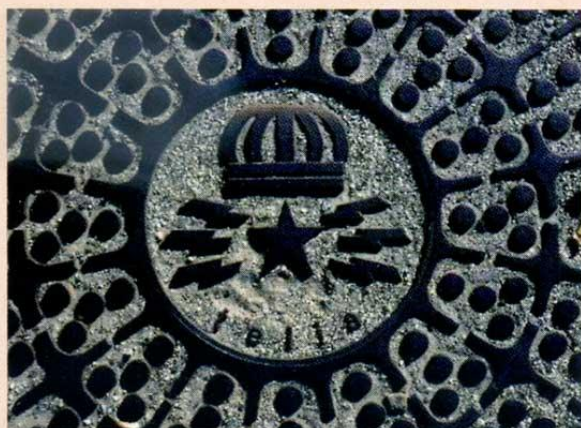
Telia-däxel i Köpenhamn.