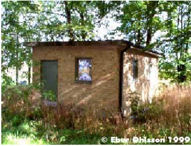
Maskinbyggnad med högtryckspumpar.