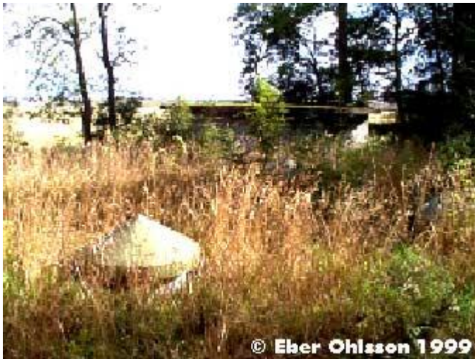
Lågreservoar under vegetationen samt luftningsbyggnad.