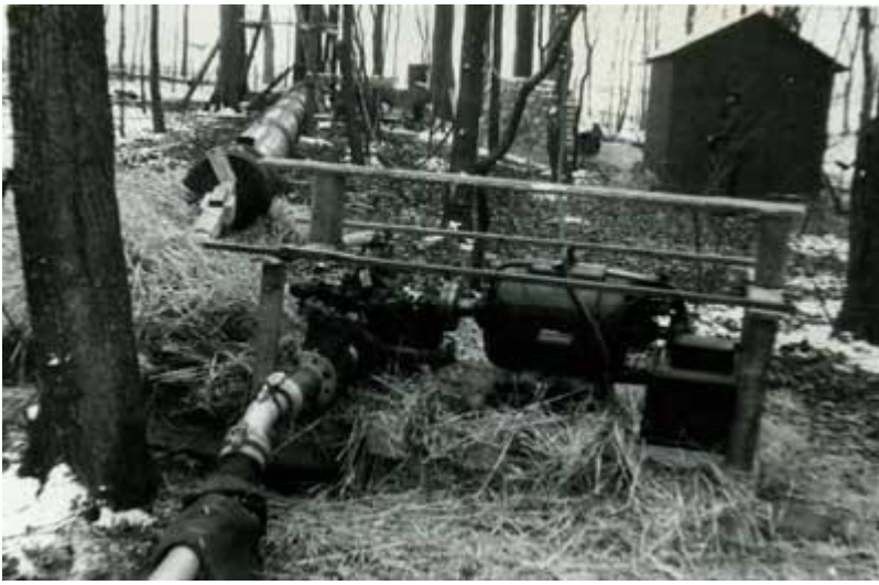
Provisorisk pumpning , februari 1947.