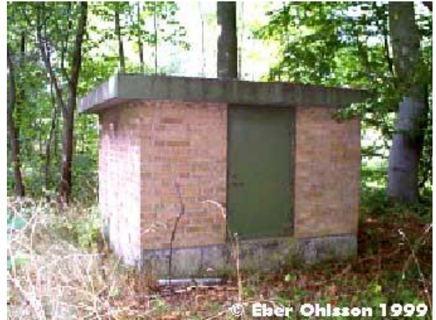
Borra med brunnsöverbyggnad.