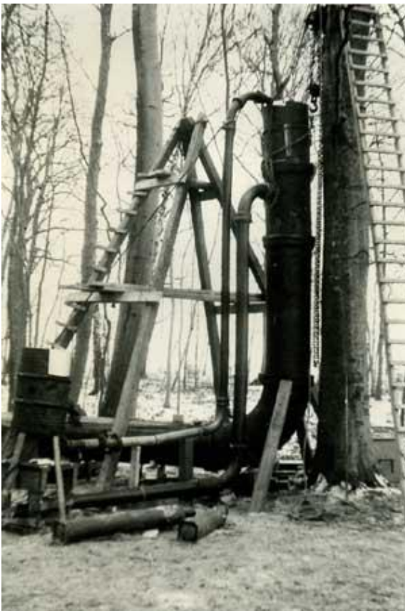
Provisorium, februari 1947.