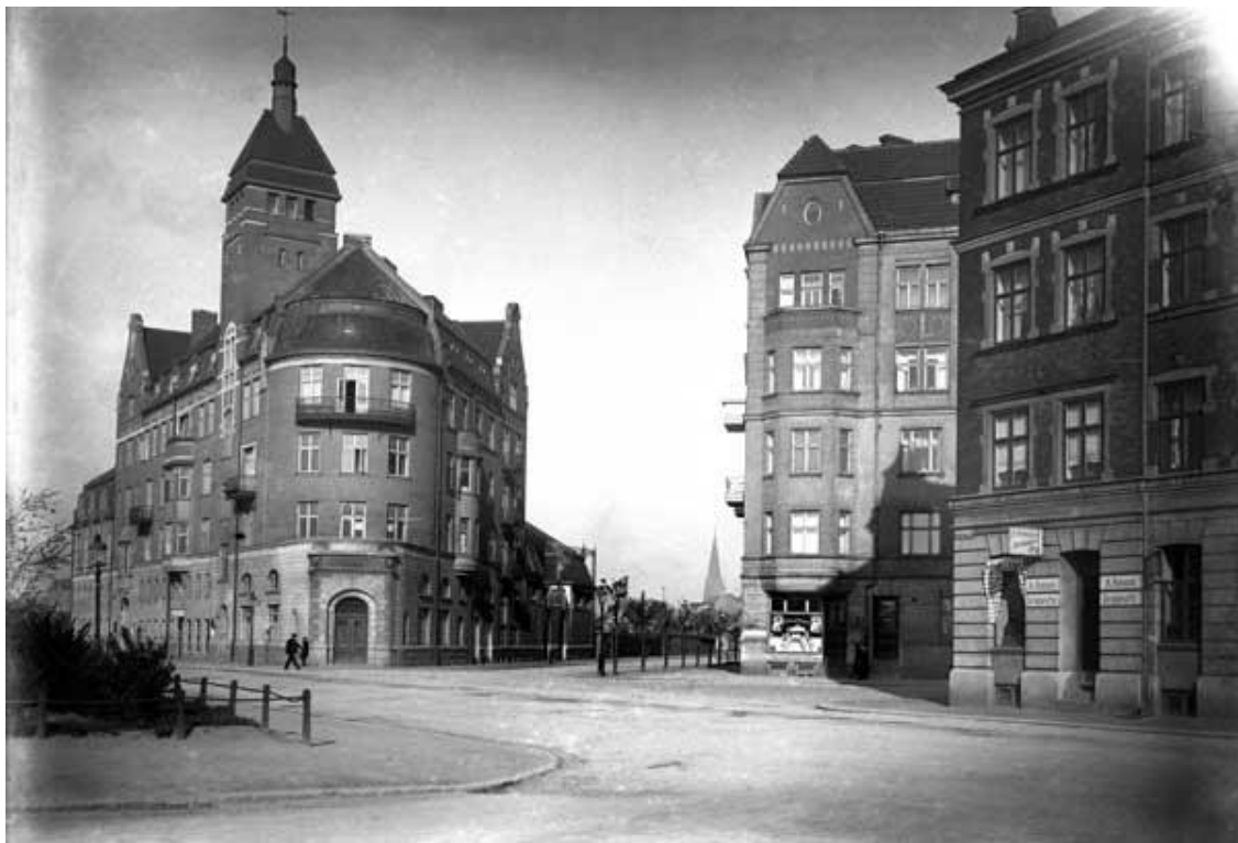
Byggnaden till vänster är Malmö folkbad i kv Gasklockan.

Kommittén lade fram sitt betänkande 1904 och konstaterar där att nyttan av bad numera var så allmänt erkänd att de inte ansåg det behövdes göra en utredning om just detta.