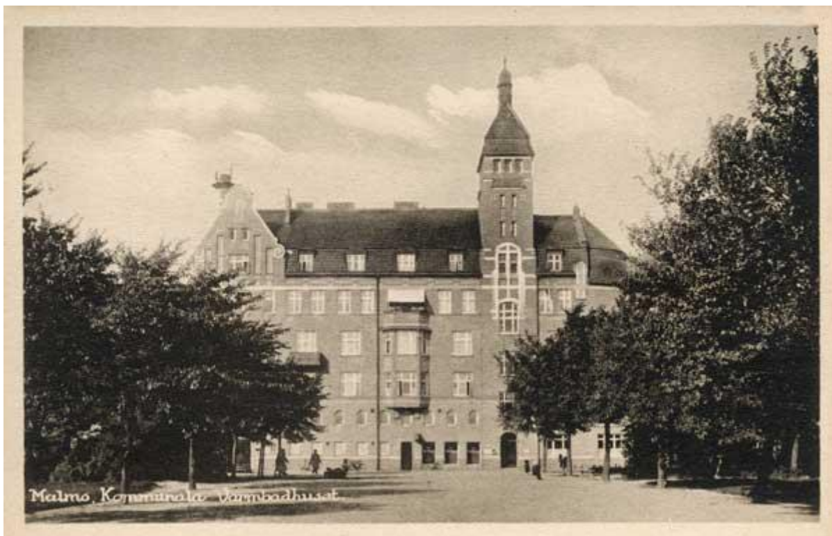
Malmö folkbad i kv Gasklockan.