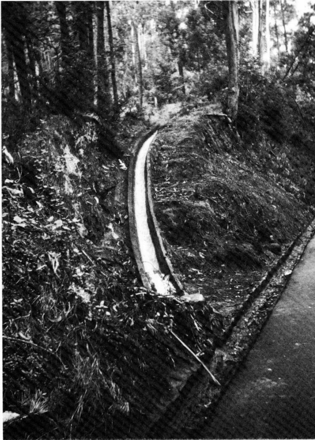
Figur 3. Levadan i skogarna utmed vägen mot Curral das Freiras.

Under 1800-talet skedde en gradvis förändring och vattenägarnas makt stärktes i förhållande till markägarnas. Mark och vatten var fortsättningsvis skilda åt, inte bara i lagstiftningen utan också i folks medvetande. Förhållandet utnyttjades av vattenägarna och vattenpriserna