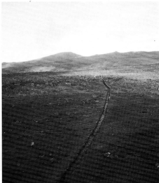
Figur 4. Levadan på högplatån Paul da Serra.

besväret. Vandrigen är helt plan, med undantag för några trappsteg här och där vid konstgjorda fall på levadan för att uppnå ett flöde. Mellan fallen rinner vattnet mycket försiktigt fram vid sidan av bananplantagerna i huvudstadens utkanter. Plastslangar ringlar iväg från levadan och ger bananplantagerna det livsnödvändiga vattnet.