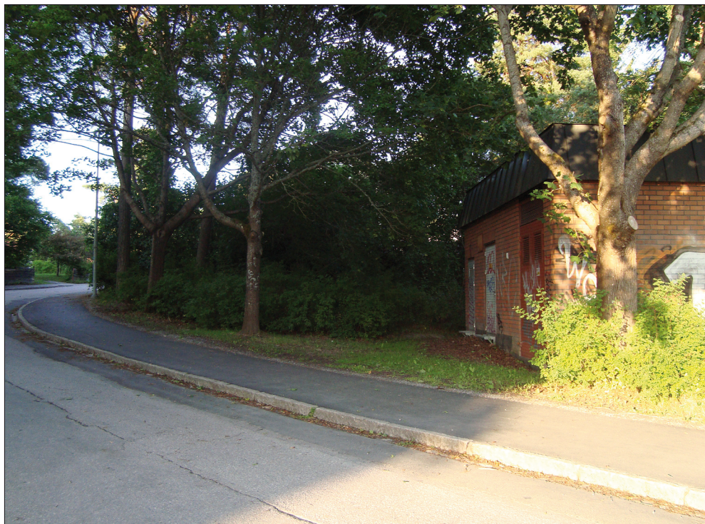
Figur 2. Mörkt grönområde. Foto: Danielle van der Burgt 2009.

våld och vilken betydelse har dessa diskussioner för hur olika familjemedlemmar använder olika platser i staden? Hur talar mammor respektive pappor med döttrar respektive söner om risken att utsättas för våld? Varnas flickor och pojkar för olika faror och vilka konsekvenser har dessa varningar för hur de använder olika platser i staden? Dessa frågor kommer jag att angripa i det kommande forskningsprojektet