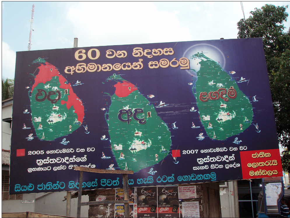
Figur 1. Affisch som visar hur LTTE:s område krympt från 2005 till 2009.

des i övergångsläger i regeringskontrollerade områden eller flydde till områden som fortfarande kontrollerades av LTTE. De som placerades i läger fick beteckningen IDP ( Internally Displaced Persons ). Enligt ett flertal media som fått tillträde till dessa läger har de behandlats förhållandevis väl och fått sina basbehov tillfredsställda. Ett allvarligt problem med dessa läger är att LTTE anses ha infiltrerat dem, vilket medfört att rörelsefriheten kommit att begränsas helt tills varje persons identitet kunnat fastställas. Ett flertal av de många tusen civila tamiler som i stället flytt mot det krympande LTTE-kontrollerade området i nordöst har intalats av tamiltigrarna att de