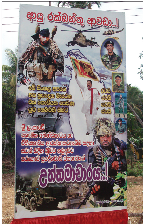
Figur 3. En av alla hundratals propagandaaffischer för regeringsarmén och landets president som satts upp runt om i landet.

krigföring mellan de stridande parterna de senaste åren har således LTTE utfört mängder av attentat på olika håll i landet, de flesta av självmordsbombare, som riktats mot oskyldiga civila med många dödsoffer som följd. Såväl tamiler som singaleser och andra minoriteter har drabbats, inklusive landets tamilske utrikesminister Lakshman Kadirgamar som mördades vid ett LTTE-attentat i augusti 2005 (Öhrling 2006).