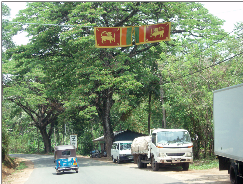
Figur 2. Stödet för regeringssidan manifesteras med Sri Lankas flaggor som satts upp i tiotusentals över hela landet. Även andra etniska grupper än singaleserna har bestämt uppmanats att sätta upp landets flagga vid sina bostäder. Foto: Staffan Öhrling 2009.

SVT 2009). Trots de risker man utsatt sig för har tiotusentals civila tamiler ändå flytt från området under 2009 och föredragit att hamna i regeringssidans IDP-läger där de åtminstone kunnat få mat, läkarvård, viss utbildning för barn och åtminstone tält eller enkla byggnader att bo i. I mars fanns uppskattningsvis 150 000 civila tamiler kvar i den lilla säkerhetszonen, som har levt under mycket svåra förhållanden, vilket uppmärksammats av omvärlden och många humanitära organisationer har velat få tillträde till denna zon. Det har dock funnits en oro hos regeringssidan då