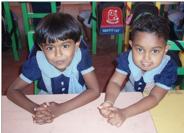
Figur 4. Två små representanter för Sri Lankas framtid.

barnen i norra delarna av landet drabbats av undernäring, dålig eller utebliven hälsovård, undermåliga utbildningsmöjligheter, egna skador eller förlust av föräldrar genom landminor och ofrivillig förflyttning från sin hemmiljö (Dissanayaka 2003).