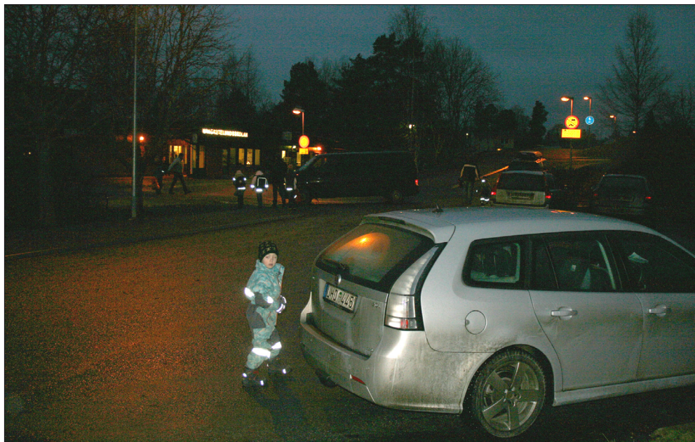
Figur 2. Barn och bilar trängs i skumma gryningsljus på små ytor vid skolan. Foto: Urban Nordin, 2009.

till skolan genom att skjutsa barnen (Barker 2006). Begreppet »regionförstoring» sammanfattar dels den vuxna befolkningens allt bättre möjlighet att nå arbetsplatser på längre avstånd, dels och parallellt företagens möjlighet att få tillgång till ett större utbud av arbetskraft. Regionförstoringen förutsätter tillgängliga transportmedel och tid. Effekterna på barn av föräldrarnas arbetspendling i och med regionförstoring är inte dokumenterade även om det har tydliggjorts att särskilt små barn påverkas negativt av föräldrarnas allt längre arbetsdagar (Nordström 2005b). Följden av längre avstånd mellan hem och skola blir sannolikt också längre arbetsdagar för barnen med ökad risk för kroniska trötthetssymtom och akuta stresstillstånd. Andra effekter av ökat avstånd till skolan är ett mer spritt och