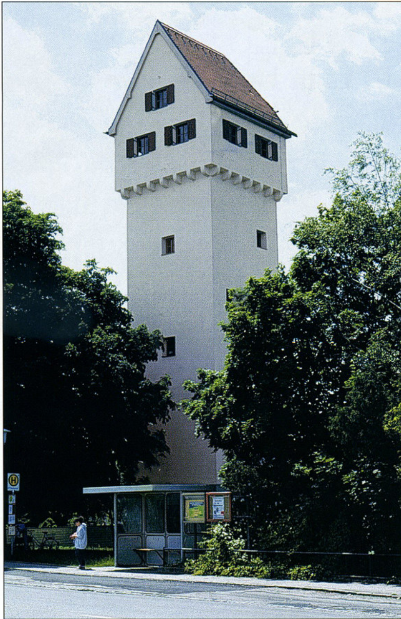
Dette vandtårn med parcelbus på toppen står i Garching nær München.