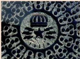
Telia-däxel i Köpenhamn.