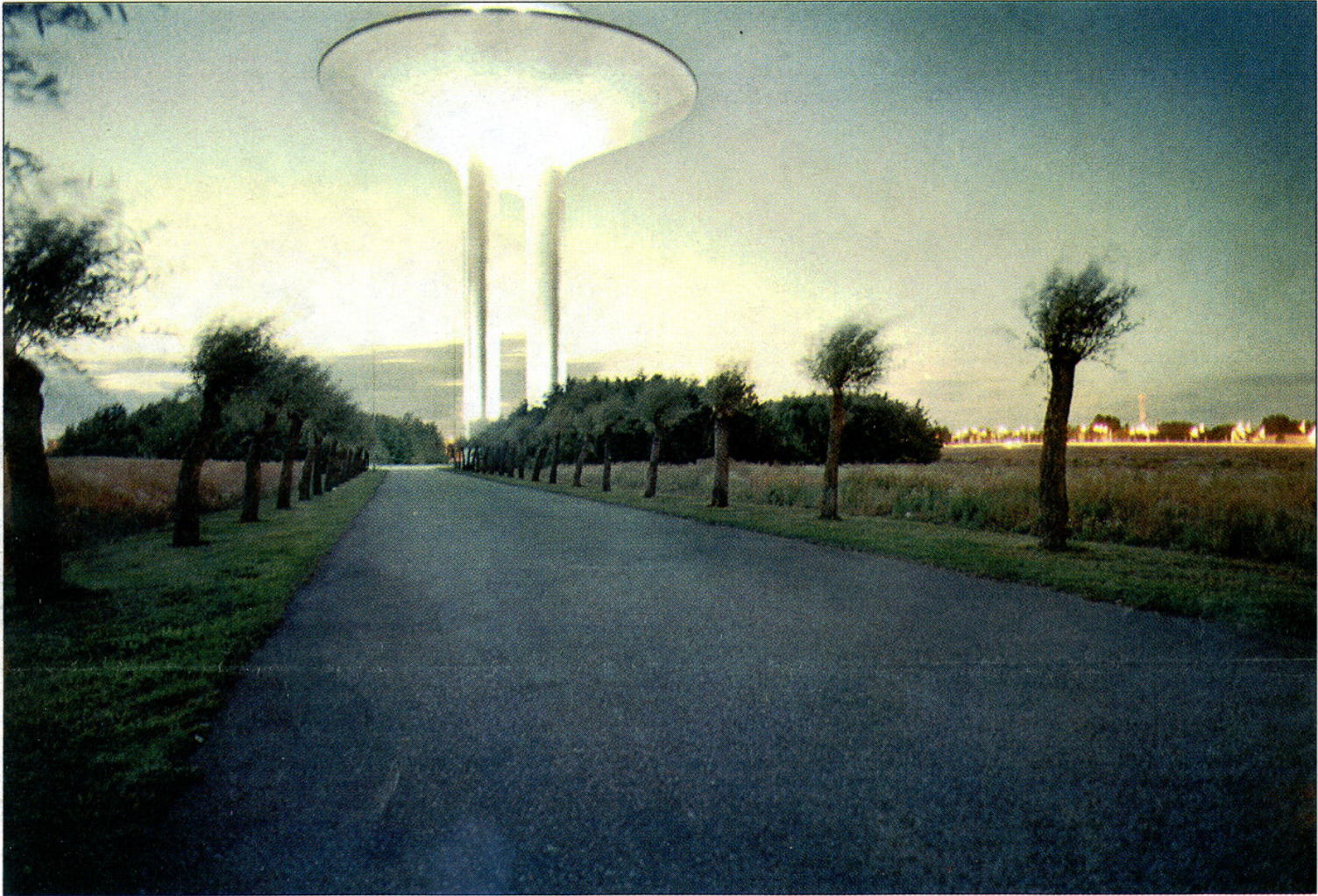
Hyllie vattentorn är ett av de finaste vattentornen i världen, tycker Eber Ohlsson, som har diabilder på 5.000 vattentorn runt om i världen. Hyllietornet byggdes 1973 och är 62 meter högt.

I och med spännbetongens intåg förändrades vattentornens